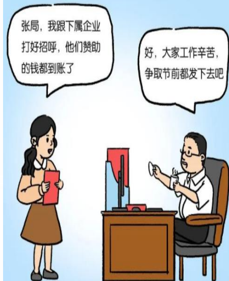
假公济私，借“集体决策”之名违规发放津补贴或福利