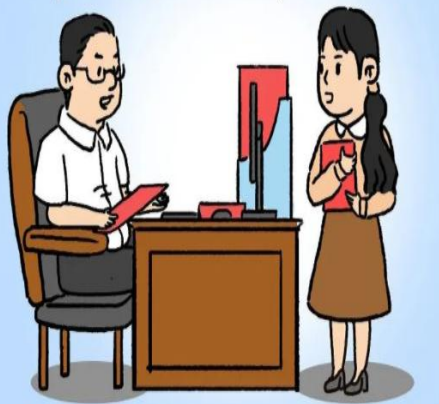
巧立名目，自行设置奖金项目发津补贴

和周总公司的合同之前不是签过了吗 张局，之前那份合同是用来给大家发奖金的，这份是入账用的