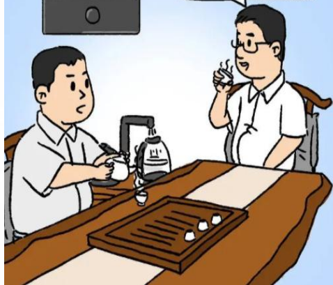
瞒天过海，违反规定向关联单位转移好处，再由关联单位给机关职工发放津补贴